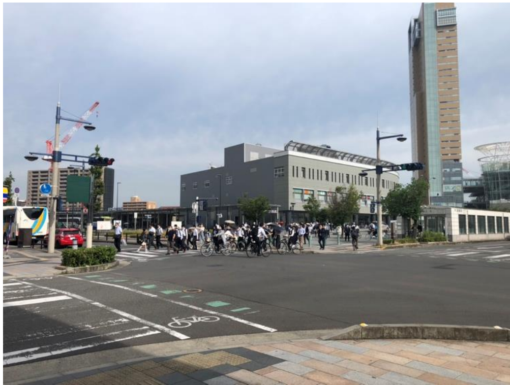
■ サイネージ前交差点