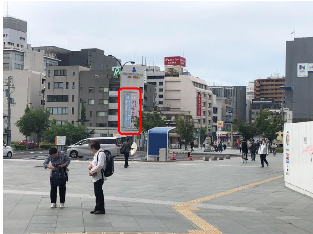
■ 高松駅 南口