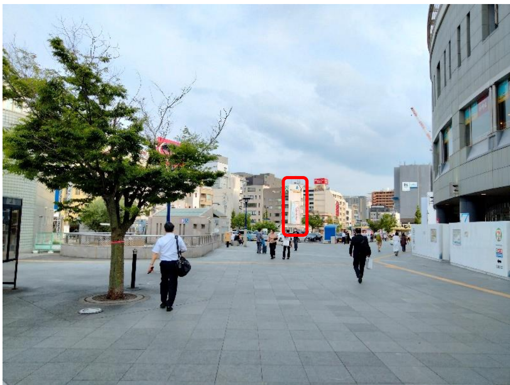
■ 高松駅 東口